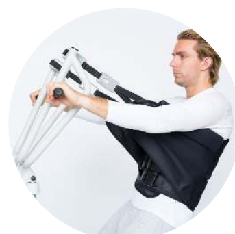
Corset actieve tilband

Tot slot zijn er onze disposable tilbanden. Deze zijn voor eenmalig gebruik en worden in bundels van 10 verkocht. Ideaal voor eenmalige, korte transfers van de zorgvrager.