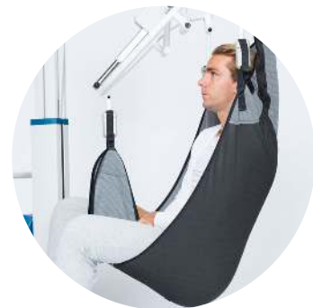
All Day tilband